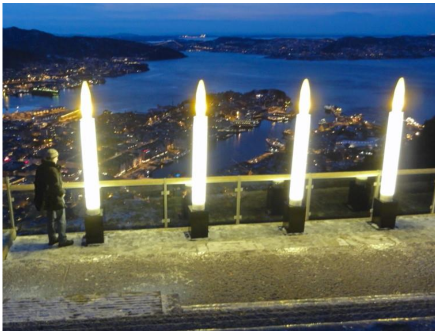
Adventsverlichting boven de stad Bergen (Noorw.)

Informatieblad voor de Protestantse Gemeente Ginneken – Ulvenhout – Bavel – Galder en Strijbeek