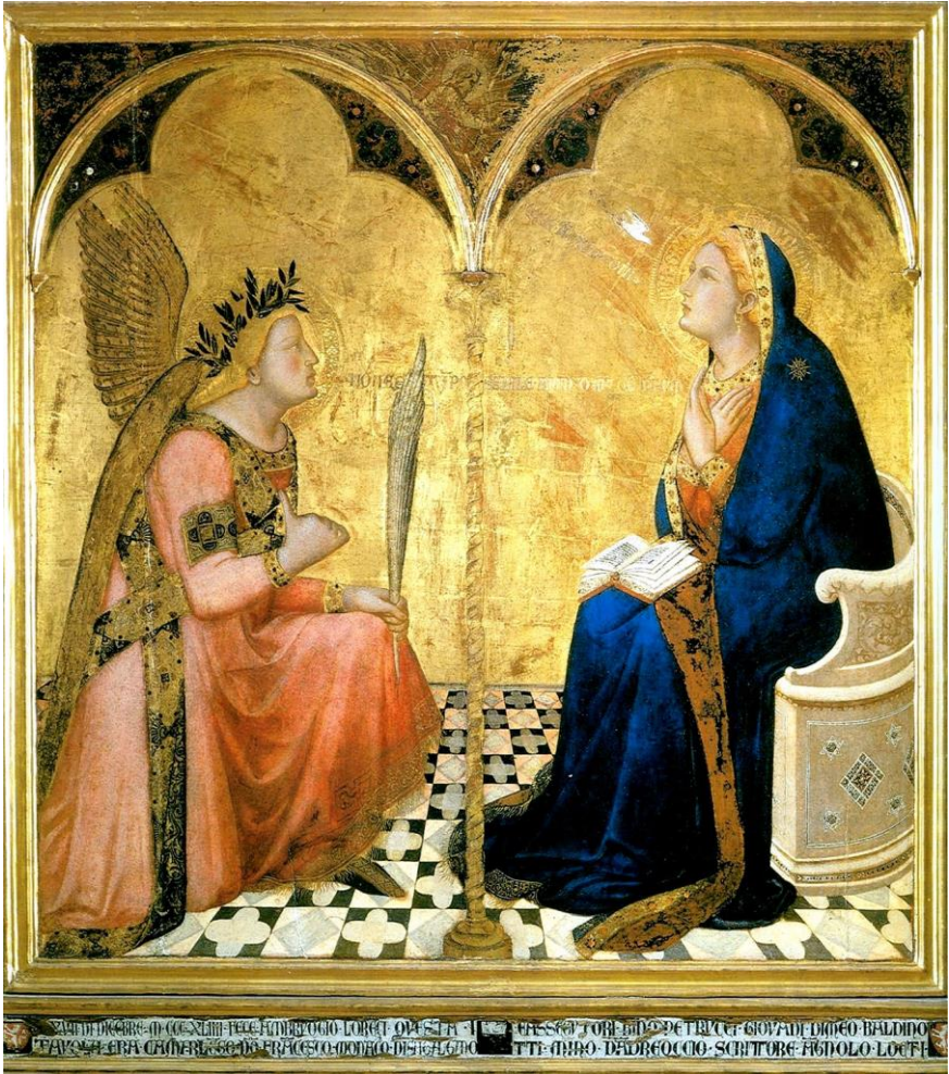
Ambrogio Lorenzetti: Annunciatie (1344)

De engel Gabriël vertelt Maria dat zij de Moeder van de Heer zal zijn. Zij verwacht dan de komst van het Kind. Ook een vorm van Advent.