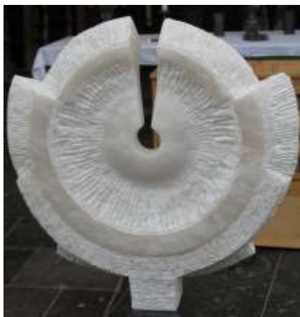
Gedragen lichtreis, L. van Eijnatte